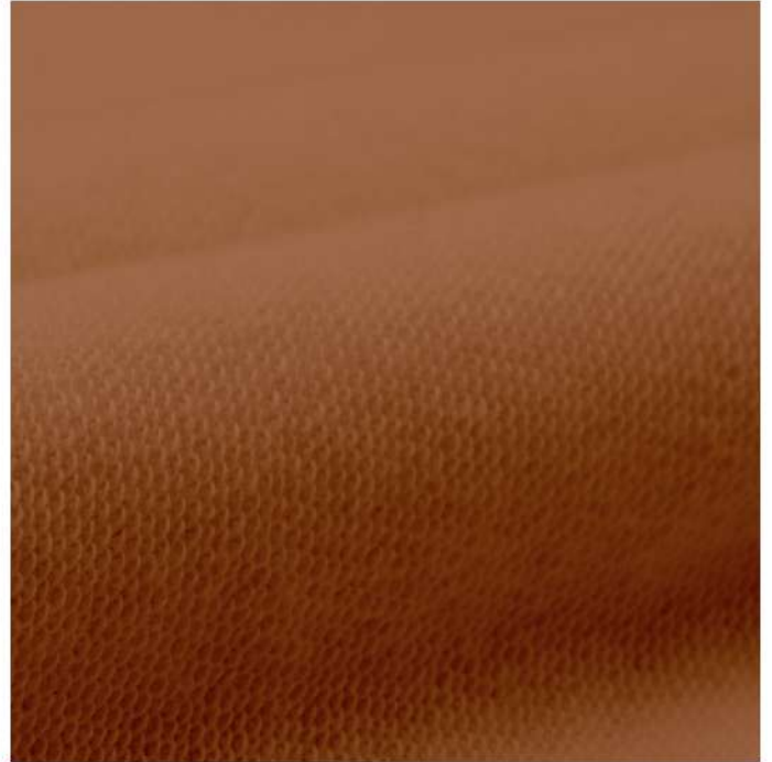
สีมอคค่ามูส/BRF230 M, ริบ BRR230 W