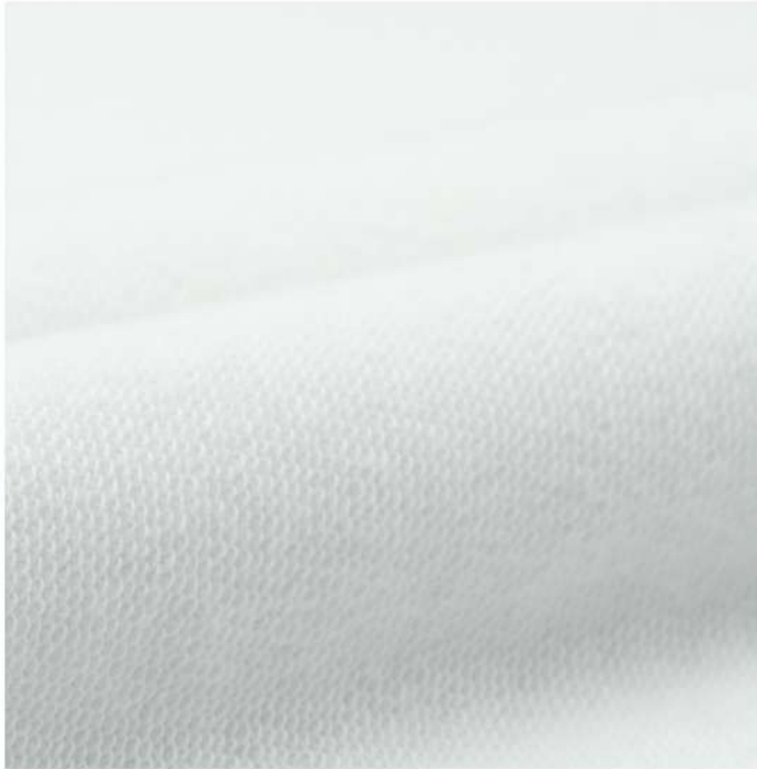
สีขาว/WHF120 W, ริบ WHR120 W