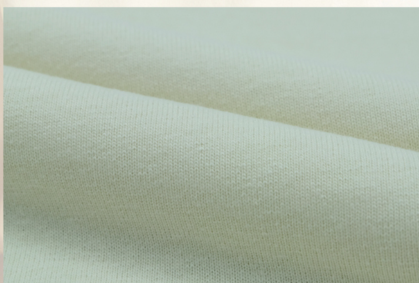
ออฟไวท์ Off White WHJ155 L