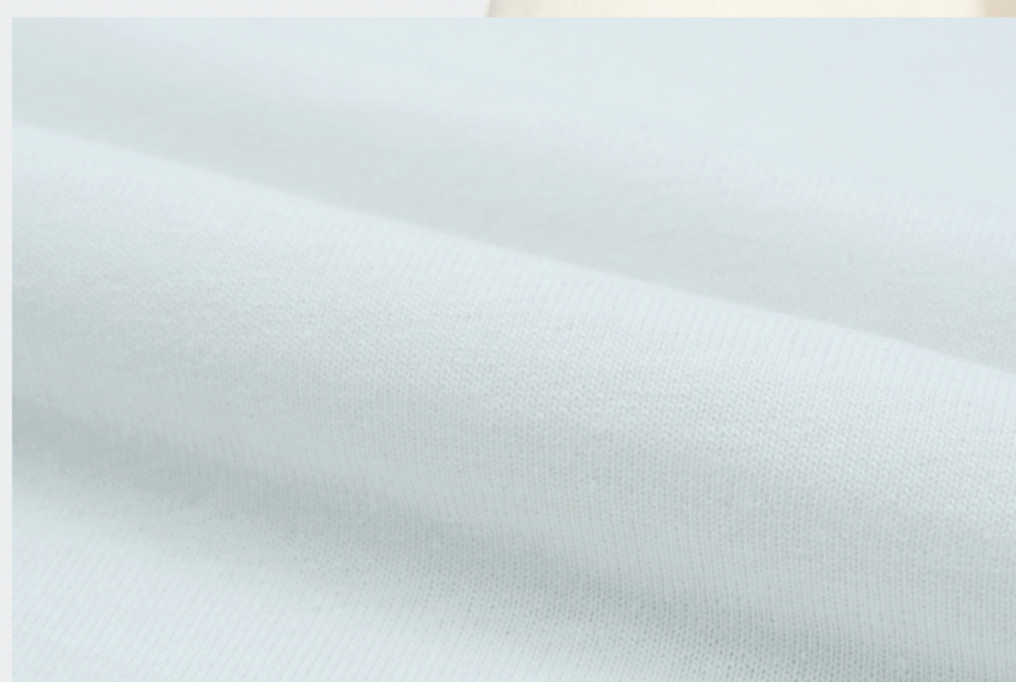
ขาว White WHJ150 W