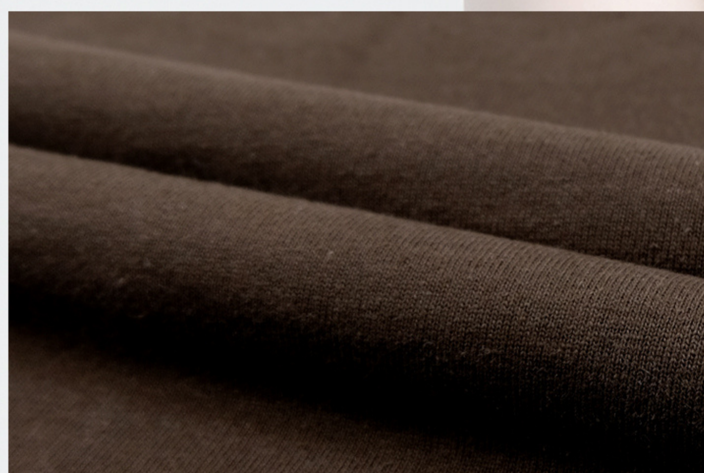
น้ำตาล Brown BRJ315 D