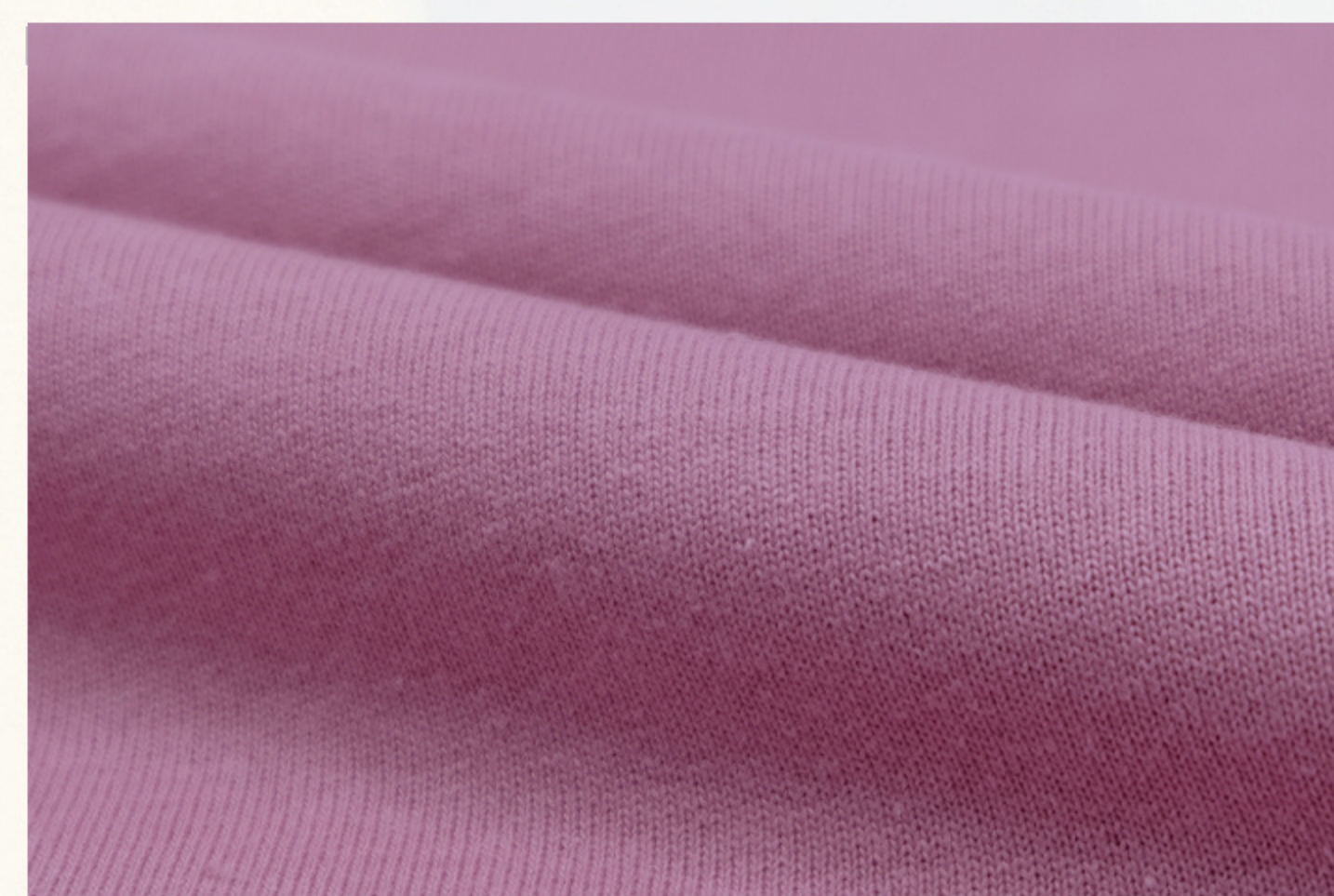
ชมพู Pink PKJ315 M