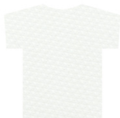
ขาว/White WHG110 W

หน้าผ้า 72 นิ้ว, น้ำหนัก 200 GSM, 14% Cotton, 86% Polyester, 2.9 คา/กิโลกรัม