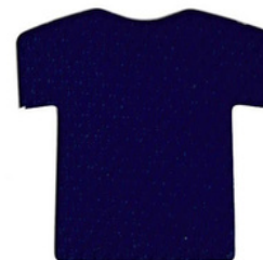
รอยัลบลู/Royal Blue BLG330 D