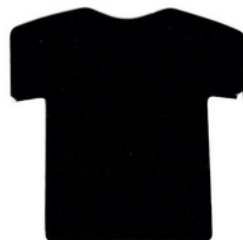
ดำ/Black BKG310 D