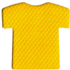
กล้วยหอม/Banana YLG310 D