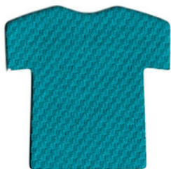
น้ำทะเล/Scuba Blue BLG320 D