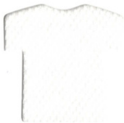
ขาว/White WHG100 W

หน้าผ้า 64 นิ้ว, น้ำหนัก 210 GSM, 22% Cotton, 78% Polyester, 3.1 คา/กิโลกรัม