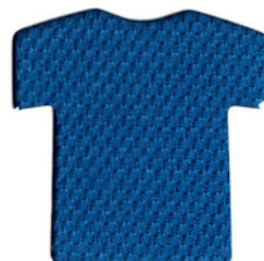
โอเชียนบลู/Ocean Blue BLG310 D