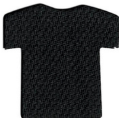
คาร์บอน/Carbon GYG310 D