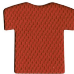
โทเมน/Deep Red RDG330 D