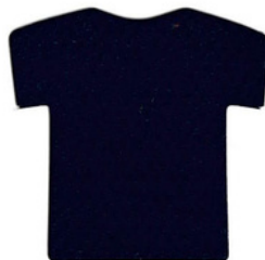
กรมท่า/Navy BLG340 D